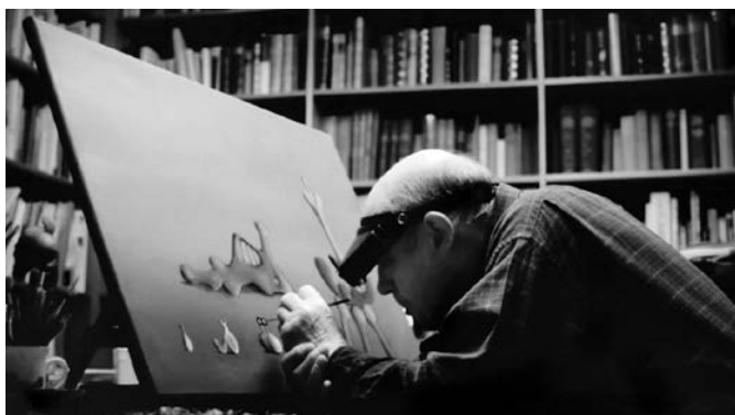
„Vždy existuje jeden další obraz, který chci namalovat.“ Desmond Morris jako surrealistický malíř, 2016.

knize, Pařížanky od Anne Seby, která je příběhem o životě Pařížanek ve čtyřicátých letech 20. století. Je plná surrealistických jmen.