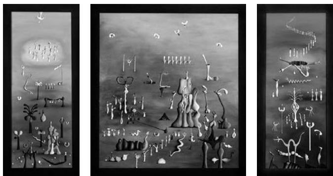
Desmond Morris, The Gathering , 2004. Triptych.

Poznal jste některé surrealistické fotografy? Například fotografka Lee Millerová, manželka pana Penrose, byla také ve vztahu s Manem Rayem, je to tak? Máte osobní zkušenost nebo něco, co byste o ní chtěl říct? Použili jsme fotografii Nusch Éluardové, kterou daroval Man Ray Lee Millerové k příležitosti narození jejího jediného dítěte, v naší jiné