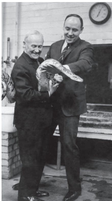
Morris a Miró, během návštěvy Joana Miróa v Londýně, 1964. Fotografie pořídila slavná fotografka Lee Millerová.

Když jsem byl mladý, kvůli druhé světové válce bylo obtížné cestovat a já si slíbil, že předtím, než zemřu, navštívím více než sto zemí. Jsem šťastný, že se mi to podařilo dříve, než jsem zestárl příliš na to, abych mohl podnikat daleké cesty. Navštívil jsem 107 různých zemí. Bylo to pro mne velmi hod-