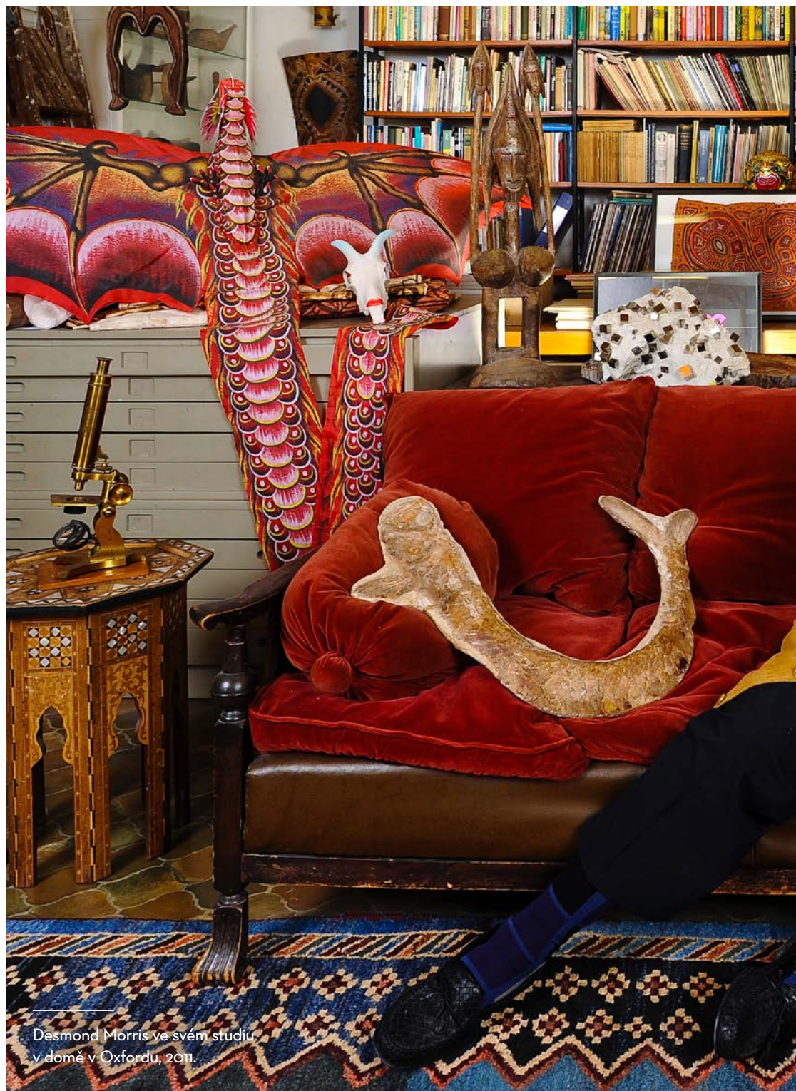
Desmond Morris ve svém studiu v domě v Oxfordu, 2011.